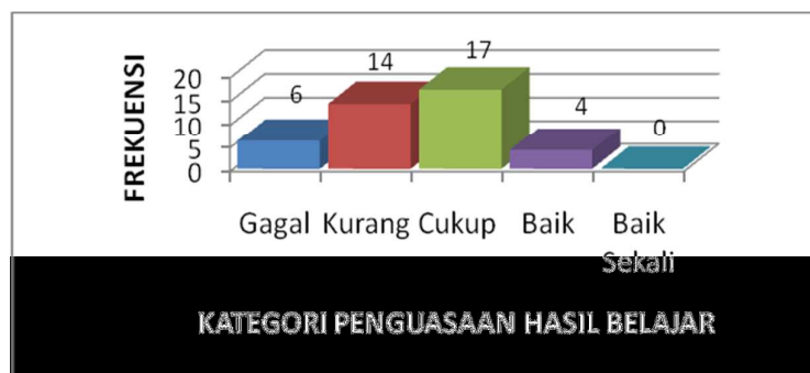
Gambar 1. Diagram batang persentase hasil belajar Biologi siswa kelas XII IPA 2

Tabel 1 menunjukkan bahwa secara individu 0% tidak ada siswa termasuk dalam kategori baik sekali, 9,76% atau 4 orang siswa termasuk dalam kategori baik, 41,46% atau 17 orang siswa dalam kategori cukup, 34,15% atau 14 orang siswa dalam kategori kurang dan 14,63% atau 6 orang siswa berada dalam kategori gagal.